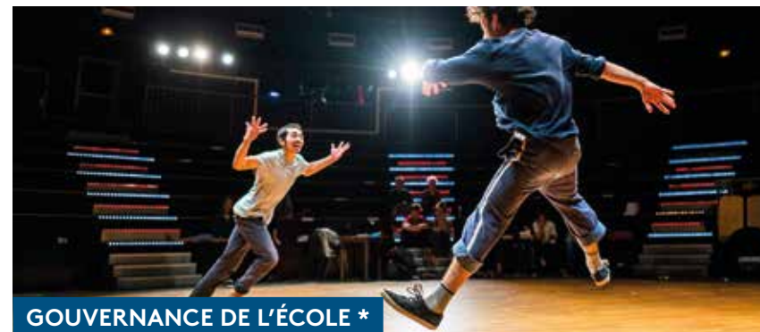
GOUVERNANCE DE L'ÉCOLE *

Les étudiant·e·s ont également accès à l'ensemble des bibliothèques universitaires.