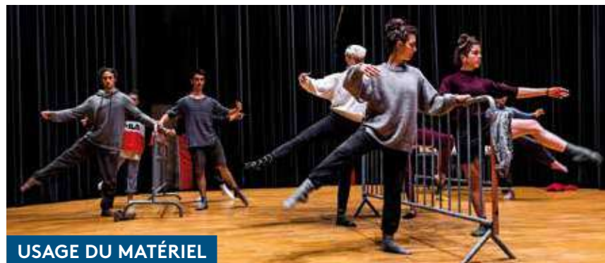
USAGE DU MATÉRIEL