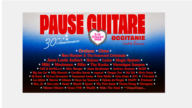
Pause Guitare : une soirée du 10 juillet entre légendes et rock international