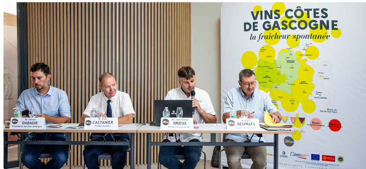
Éauze : les vins des Côtes de Gascogne font le point

Sur les changements en cours dans la production et la consommation