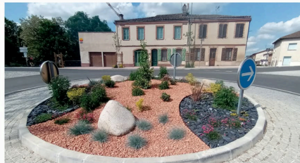
Nouvelles Lislols - n°50 - juin-août 2026

Ce projet a bénéficié de financements de l'État au titre de la DETR et du Conseil départemental du Gers, contribuant à la réalisation d'aménagements durables et qualitatifs en entrée de ville.