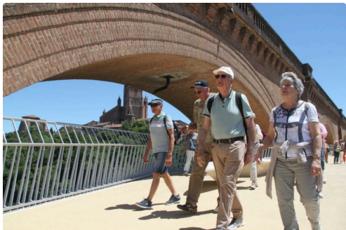
La nouvelle passerelle