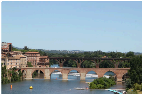
le vieux pont