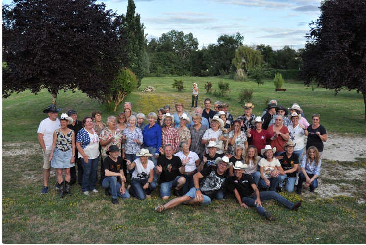
Des Normands fidèles au rendez-vous du Country Club de Vic-Fezensac

Les kilomètres ne semblent pas peser bien lourd lorsqu'il s'agit de partager une même passion. Pour la troisième année consécutive, un groupe de danseurs venus de Normandie et de la région parisienne a fait escale à Vic-Fezensac pour retrouver ses amis du Country Club local.