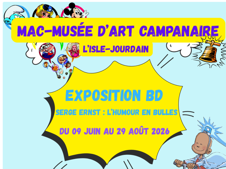
Serge ERNST : l'humour en bulles s'invite au musée d'Art Campanaire

Le Musée d'Art Campanaire de L'Isle-Jourdain accueille du 9 juin au 29 août 2026 une exposition exceptionnelle consacrée au dessinateur de bande dessinée Serge Ernst, figure incontournable de l'humour graphique.