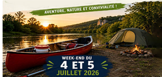
Grosses chaleurs ! envie de fraîcheur ?