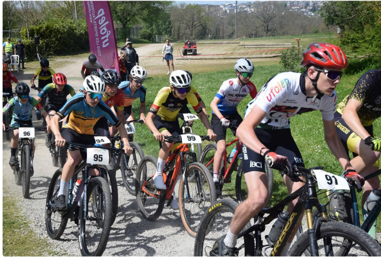
Le Gers brille au championnat régional de VTT XC en Aveyron

Le championnat régional de VTT cross-country s'est déroulé le week-end du 19 avril au Domaine de Combelle, à Rodez, en Aveyron, dans un cadre exceptionnel au cœur d'un magnifique domaine équestre.