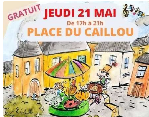
L'association Kiosk dévoile ses ambitions

Place du Caillou : des animations le 21 mai et le 13 juin sont programmées en attendant l'ouverture d'un nouveau local culturel