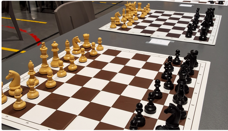
"Le jeu le plus dur au monde" à Auch, les écoliers se sont mesurés sur l'échiquier.

Ce Lundi à la salle du Mouzon, l'Échiquier d'Armagnac a réuni les élèves de primaire pour une journée d'échecs scolaires. Concentration, fair-play et entraide au programme.