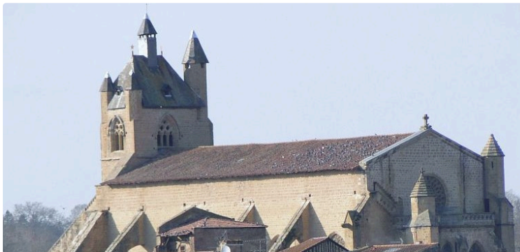
Annonces paroissiales du 11 au 19 mars 2026

Samedi 11 avril 2026 : Pèlerinage en famille à Lourdes.