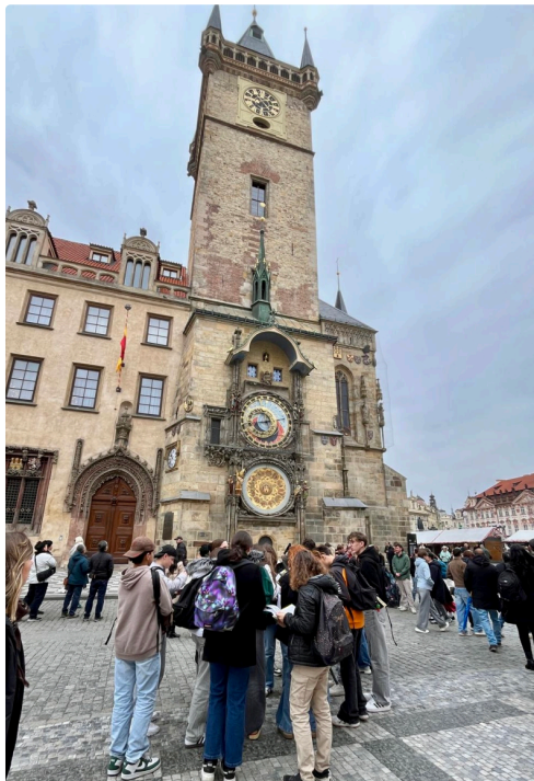
A Prague, devant l'horloge astronomique