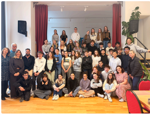
Moins de soleil mais chaude ambiance à Prague