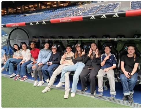
Occuper les sièges des remplaçants dans l'un des plus beaux stades du monde