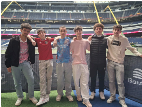
De quoi envisager de devenir eux aussi de grands champions !