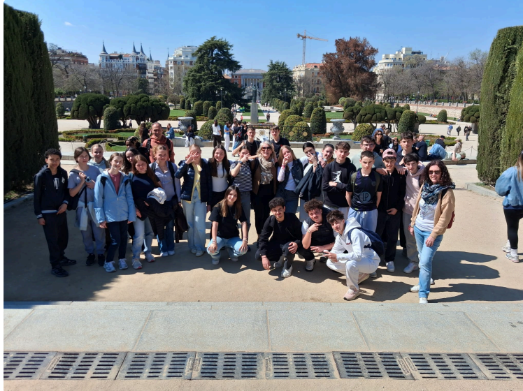
Deux destinations différentes mais pour les deux un projet pédagogique travaillé en amont

Avec les classes de 3ème du Collège Simone Veil