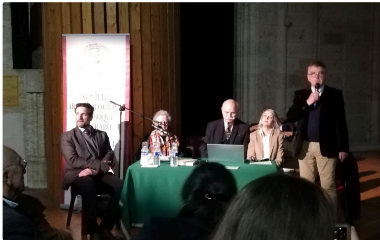
Société Archéologique du Gers, communications avril 2026