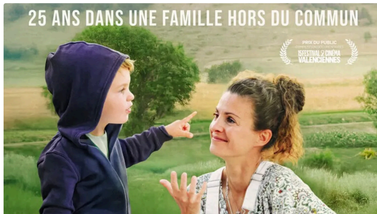
Un film ST-SME, quèsaco ?

Au cinéma les films sont parfois en VF ou en VOST; Soit en Version Française, lorsqu'un film est tourné en langue étrangère et qu' un doublage des voix est réalisé par des acteurs en français; Ou en Version Original Sous-titrée lorsque l'audio est celui du tournage d'origine (quelque soit la langue) et la traduction se fait par un texte en français qui apparait en bas de l'écran.