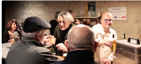
Par ici la monnaie!