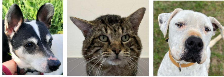
Pleins feux sur Mimosa, Horus et Falco cette semaine !

Cette semaine, la SPA vous présente Mimosa, le gentil doyen, le bavard Horus et l'adorable dogue Falco.