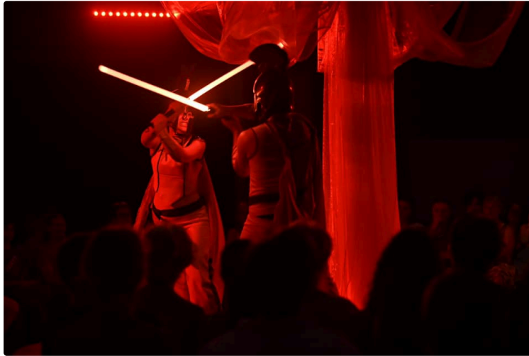
"Antigone" par La Boîte à jouer à Castéra !