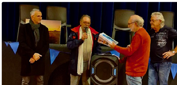
Ca roule toujours aussi bien pour les bleuets mirandais

50 ans sur la route, 50 ans dans le cœur !