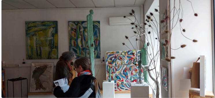
Poussez la porte de La Ligne ROUGE pour un "Café à la galerie" ce dimanche !