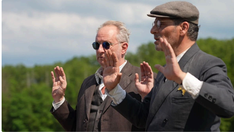
Cinequanon : animation, thriller et drames au programme de la semaine

Cette semaine, des films d'animation, un thriller et des drames émouvants.