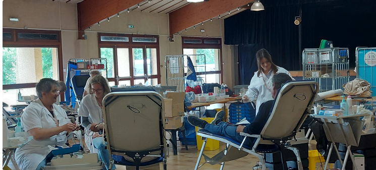
Don du sang du 27 et 28 novembre : les associations vicoises partenaires !

L'amicale vicoise pour le don de sang bénévole vous attend