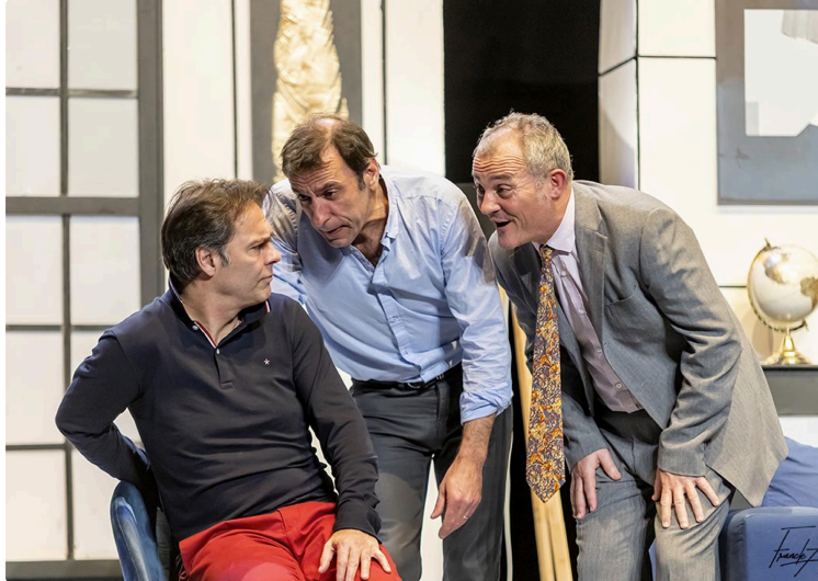
In § Off propose la pièce culte "Le dîner de cons" !

Deuxième soirée-théâtre proposée par l'association In § Off