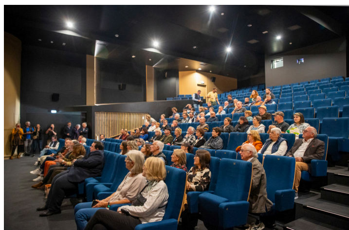
Autre vue de la salle