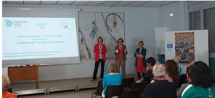
"Mieux comprendre la santé mentale : parlons-en", une conférence pleine d'enseignement proposée par La Bienfaisance

L'association La Bienfaisance proposait samedi 11 octobre à la mairie de Vic-Fezensac une conférence sur la Santé Mentale " Mieux comprendre la santé mentale: parlons-en"