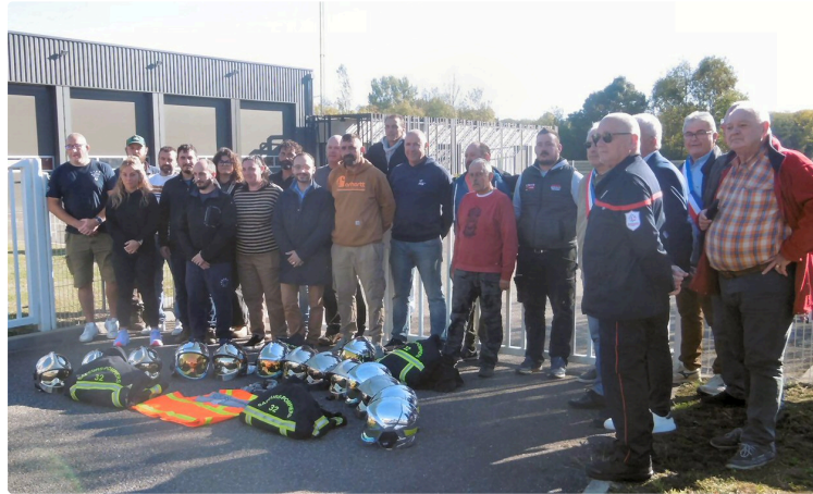
Les pompiers dans la grogne

trop de revendications restées sans réponse