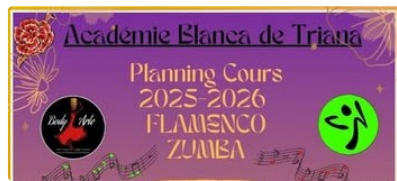
Planning danse – Saison 2025-2026