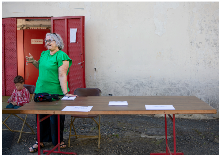
Aignan Animation (Organisation d'animations dans la commune d'Aignan)