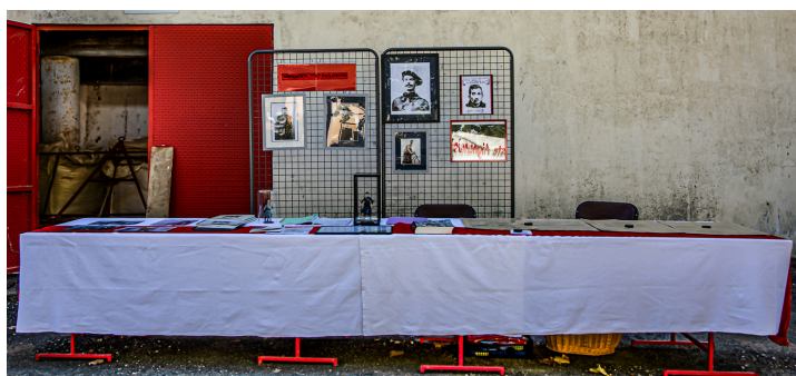
Stand de l'Association Paul-Fontan (histoire d'un Aignonais mort pendant la guerre de 1914-1918 ; un espace lui est consacré à Aignan)