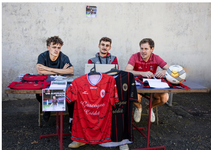
Le football avec l'Union Sportive Aignanaise