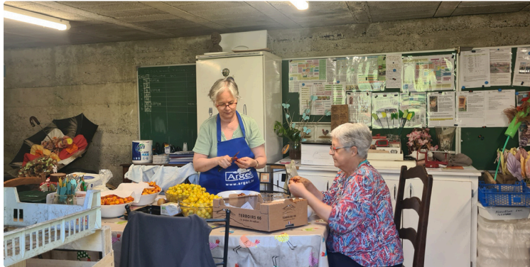
Pratiquer le jardinage sans douleur