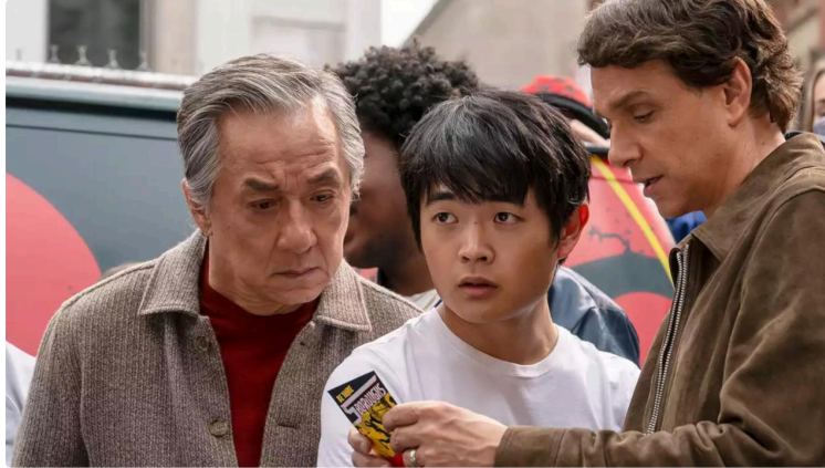
Cinequanon : on profite encore des vacances !

Encore quelques jours de vacances avec un programme pour tous les âges !