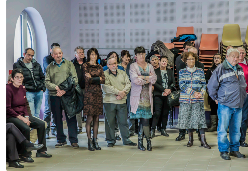
Autre vue de l'assistance