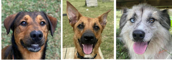
Tori, Luther et Paholo, les nouveaux venus de l'été

Cette semaine, la SPA vous présente trois loulous arrivés le mois dernier, le jeune Tori, Luther, la demoiselle, et le timide Paholo.