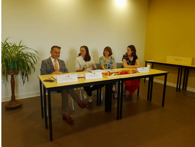
La Communauté de communes signe la charte d'engagements PNNS (Programme National Nutrition Santé)