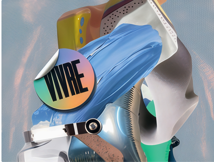
Memento 2025: Vivre

Depuis 2016, MEMENTO, installé dans un ancien carmel d'Auch, s'impose comme un lieu emblématique de l'art contemporain en milieu rural. Porté par le Département du Gers, ce projet culturel unique en France incarne une politique ambitieuse, exigeante et profondément humaine. Bien plus qu'un simple espace d'exposition, MEMENTO est un lieu vivant de dialogue, de partage et de mixité sociale , ouvert à tous. Il tisse des liens avec les domaines médico-sociaux, l'éducation, l'insertion et les publics éloignés de la culture. L'exposition 2025, intitulée VIVRE, incarne pleinement ces valeurs : gratuité, accessibilité, inclusion et soutien aux artistes, en particulier ceux fragilisés par la crise.