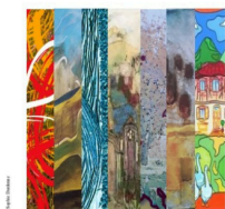
La Ronde des Expos Du 9 au 17 août 2025 www.larondedesexpos.com 06.81.75.96.96 ou 06.76.26.58.89