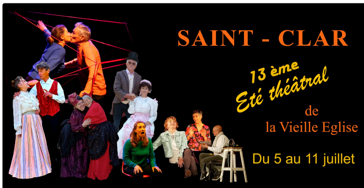
Au théâtre certains soirs d'été...

Le week-end prochain du 5 au 11 juillet se déroulera le 13ème Festival théâtral, cela à la Vieille Eglise.