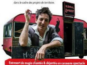
Entresort de magie chantée & déjantée en caravane spectacle

19 mn - dès 10 ans - 3€ Sur réservation au 05 62 61 65 00