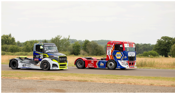
Course 4 : Thomas Robineau n°2 devant Raphaël Sousa n°21