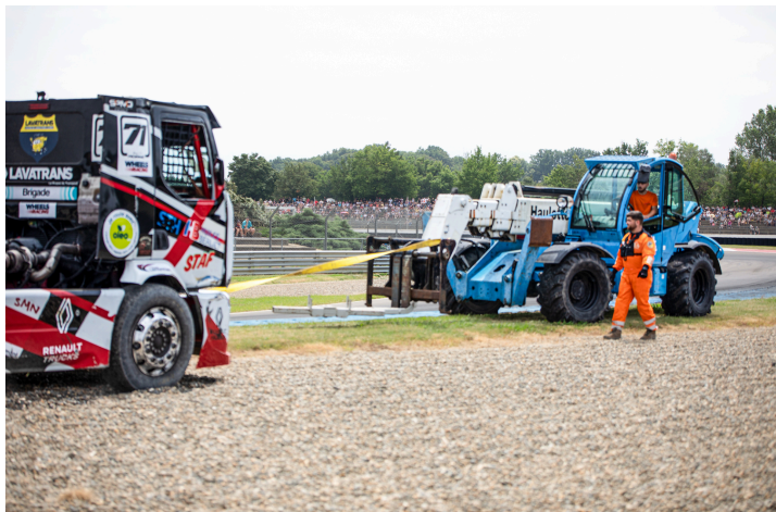
Course 3 : remorquage après un virage manqué et un atterrissage dans les cailloux