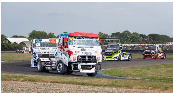
Course 4 : Fabien Neel n° 14, Aurélien Herrgott n°68, Raphaël Sousa n°21 et Téo Calvet n°20