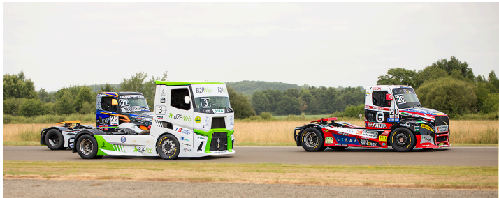
Course 3 : Téo Calvet n°20, Lionel Montagne n°3 et José Sousa n°22