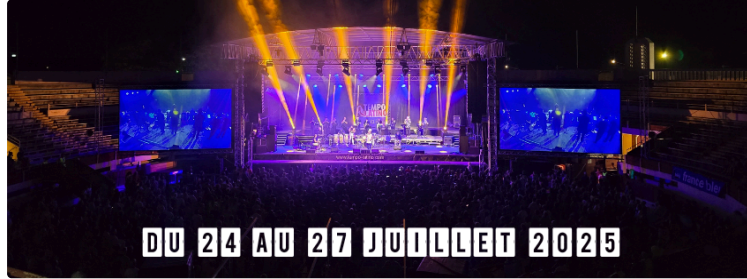
Tempo Latino 2025 côté pratique : venir, se déplacer, dormir

Après le programme, voici venu le temps des informations pratiques !