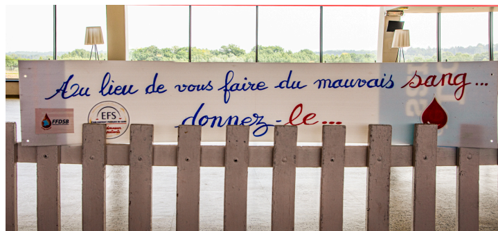
Le slogan du jour