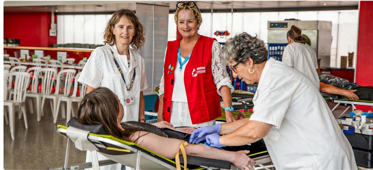
Record pour la collecte de sang au circuit de Nogaro

100 donneurs se sont déplacés malgré la chaleur