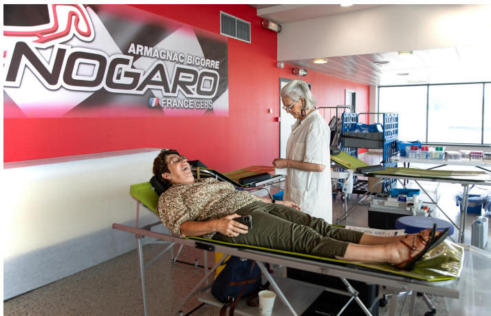
Une donneuse de sang très souriante

Les enfants du Centre d'accueil et de loisirs, venus en woodybus, ont posé beaucoup de questions (de futurs donneurs?).