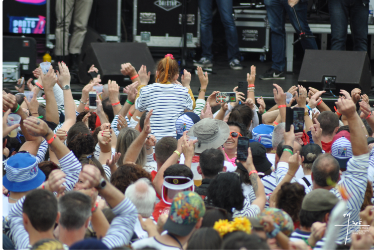
Pentecôtavic 2025 : un record mondial à battre dimanche !

Les fêtes sont bien lancées, les festayres sont au rendez-vous, très nombreux au point que la municipalité a dû ouvrir à 15 h le stade de Goulin, Cauderon et les Acacias affichant complets samedi midi !