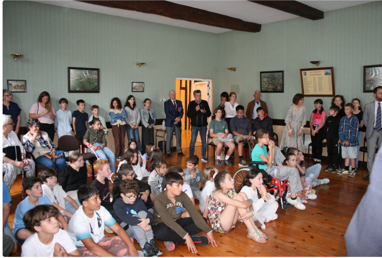
Remise des prix de la Citoyenneté aux quatre établissements scolaires de Masseube

En orésence des personnalités du département