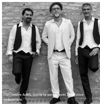
L'orchestre A-BAL ouvre la soirée avec un groove irrésistible