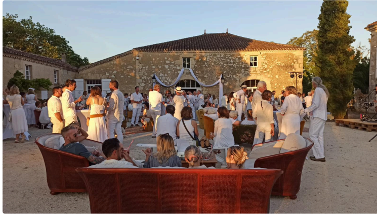
"Cocktail en blanc" au château Arton : une soirée d'exception avec le meilleur ouvrier de France Barman

.....De 18h à 2h ..... À partir de 35 €.....Château Arton vous invite à vivre une soirée inédite mêlant cocktail d'exception, art vivant et terroir gascon.