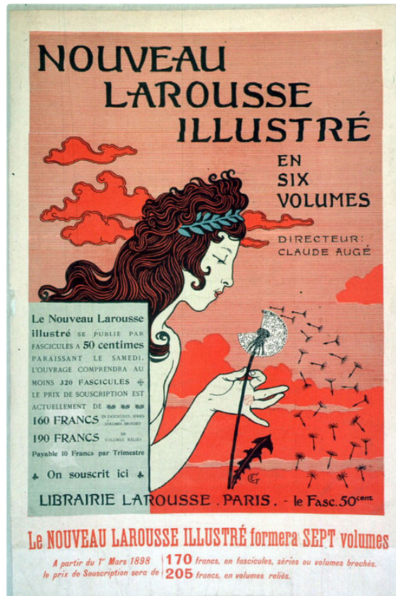
Des nouvelles de Claude Augé : la semeuse nue dite la scandaleuse

Tout le monde connaît la Semeuse, emblème des éditions Larousse, cette jeune femme soufflant sur un pissenlit, qui répand ses graines comme les dictionnaires répandent leur savoir à travers le monde.