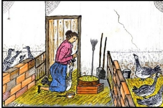
Juin au musée : les bénévoles en action, entre accueil, animations et patrimoine

Alors que les températures estivales s'installent avec une certaine précocité et que les champs de blé se parent déjà de leurs premières teintes dorées, la vie bat son plein au musée paysan d'Émile. Juin n'offre aucun répit aux bénévoles de cette institution vivante du patrimoine rural : entre enthousiasme et sens du partage, ils poursuivent sans relâche leur mission de transmission.