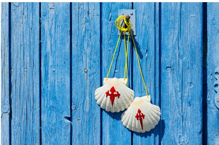
Coquilles Saint-Jacques