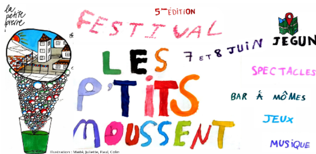
Festival Les P'tits Moussent, 5e édition : demandez le programme !

Voici venu le temps du festival Les P'tits Moussent, 5e édition, un festival organisé par des familles, pour des familles