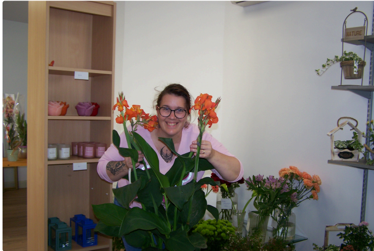
" Le jardin fleuri " une fleuriste s'installe à Saint-Clar.

C'est une aubaine pour les St Clarais car cela manquait !