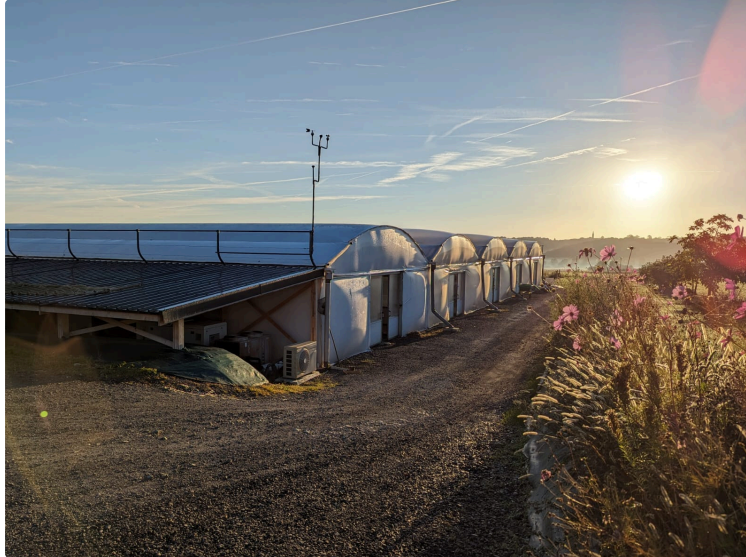
Portes ouvertes à la ferme d'aquaponie Eauzons

Journée Portes Ouvertes à notre ferme EAUZONS à Aux Aussat samedi 17 mai. L'occasion pour le public de découvrir l'univers, les produits, avec des crevettes et premières fleurs de vanille !