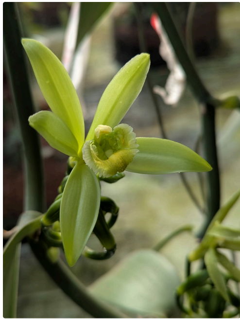
Fleur de vanille