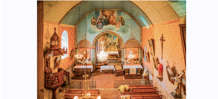
Concert du baroque au romantique à l'église de Pouydraguin

La belle église Saint-Césaire de Pouydraguin doit être rénovée. C'est à cette tâche que s'est attelée l'association le Piton. Elle organise un nouveau concert, allant du baroque au romantique, dimanche 18 mai à 17 heures à l'église. Entrée et participation libres.